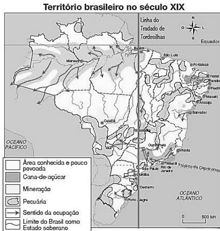
Adaptado do Atlas Histórico e Geográfico Brasileiro . Rio de Janeiro, MEC, 1967.

O mapa a seguir pode te ajudar a responder as questões 7 e 8.